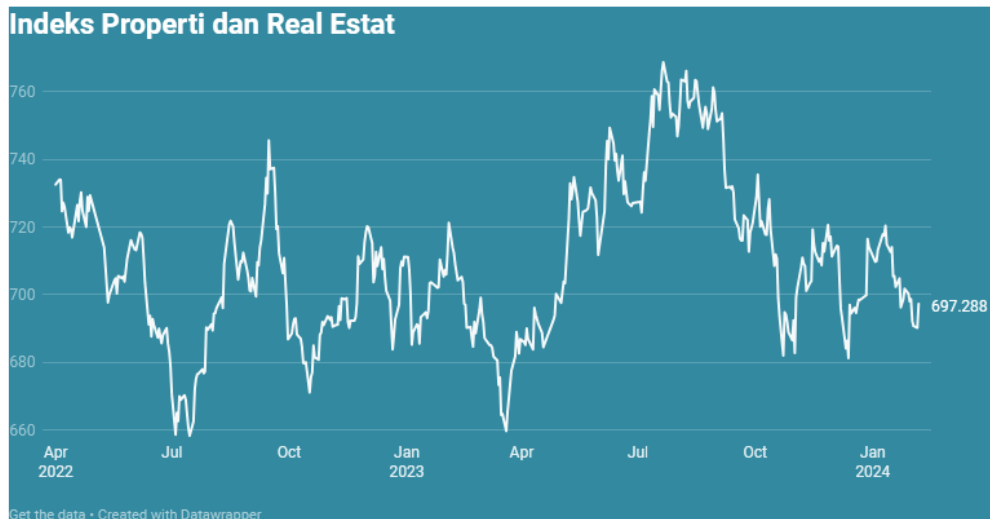
Gambar 1. Perkembangan indeks properti dan real estat

Kondisi perusahaan sektor properti meski sempat mengalami penurunan saat pandemi, pertumbuhan tahunan (yoy) indeks harga properti residensial tak pernah kurang dari 1,5% sejak 2022 (Gambar 1). Pada kuartal kedua 2023, indeks harganya mencapai 107,26 atau tumbuh 1,79% dibandingkan kuartal yang sama tahun lalu (Datanesia, 2023). Salah satu penyebab utamanya properti digemari oleh investor disebabkan semakin bertambahnya jumlah penduduk di Indonesia. Namun dari hasil kinerja saham beberapa perusahaan properti justru mengalami tren penurunan (CNBC, 2023). Hal tersebut menunjukkan penurunan harga saham mencerminkan berkurangnya kepercayaan investor terhadap pertumbuhan dan profitabilitas perusahaan di masa depan.