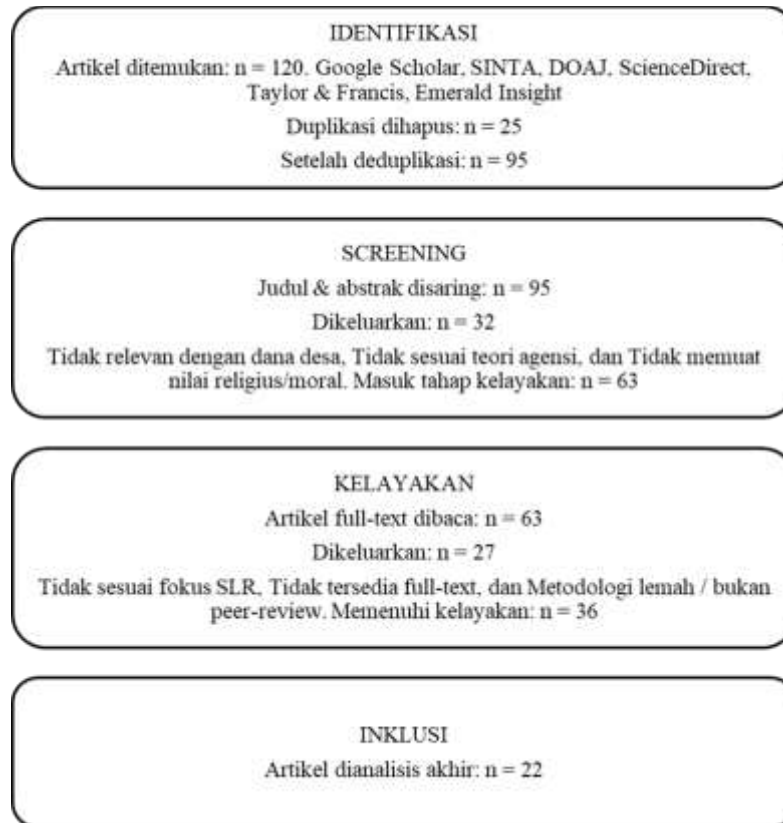
Gambar 1. Diagram Alur PRISMA

Untuk memperkuat transparansi proses seleksi, ringkasan kuantitatif jumlah artikel pada setiap tahap ditampilkan pada Tabel 2.